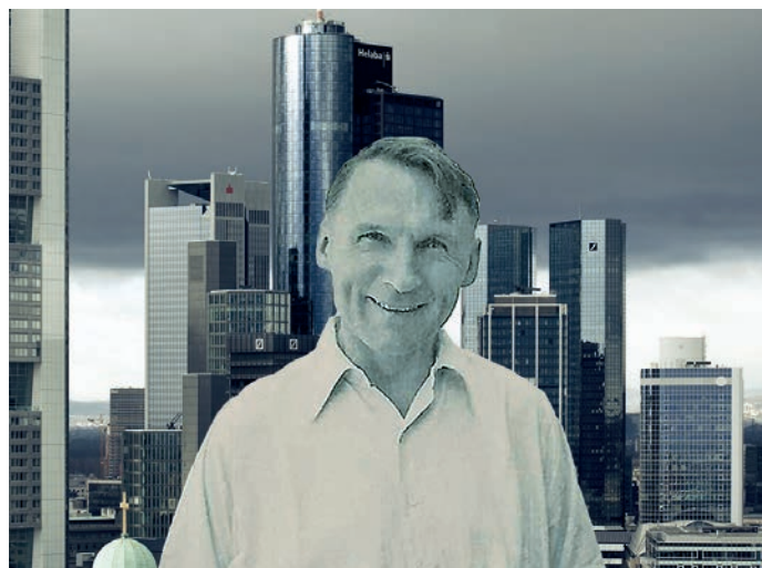
Walter Dirks 1947/1948, Fotomontage, Walter Dirks, Skyline

Der Name des Publizisten WalterDirks (1901-1991) steht in Frankfurt für einen weltoffenen, sozial sensiblen und kulturell aufgeschlossenen Katholizismus. In dieser Tradition greifen das (von Dirks mit begründete) Haus der Volksarbeit und die Katholische Akademie Rabanus Maurus neue Fragestellungen auf, zu denen seine Perspektiven hilfreich sein können.