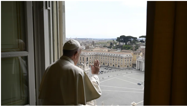
Papst Franziskus schaut während des Regina-caeli-Gebetes aus dem Fenster im Apostolischen Palast auf dem menschenleeren Petersplatz.

Die berühmteste Utopie, die dem Genre seinen Namen gab, stammt von dem Renaissancepolitiker Thomas Morus. 1516 erschien in England Vom besten Zustand des Staates oder von der neuen Insel Utopia . Ein halbes Jahrtausend lang inspirierte der Roman das abendländische Denken: von Campanella und Rabelais über Bacon und Milton, Marx und Engels, Bloch und Benjamin bis zu Orwell und Huxley. Doch mit dem Mauerfall 1989 schienen die utopischen Energien erschöpft und die Menschheit in der besten aller möglichen Welten angekommen. Ende der Geschichte? Jetzt schreibt ein Papst noch einmal eine Utopie: Franziskus entwickelt seine Enzyklika Fratelli tutti wie die klassischen Autoren des Genres aus der Kritik an Ungerechtigkeit, Ungleichheit, Unterdrückung. Anders als sie entwirft er jedoch keinen idealen Staat, sondern eine brüderliche Welt. Dabei wendet Jorge Mario Bergoglio sich, wie in päpstlichen Lehrschreiben seit den 1960ern üblich, "an alle Menschen guten Willens". Im Titel zitiert er den Bettelmönch Franz von Assisi, der während der Kreuzzüge als Friedensprediger zu einem Sultan ging. Und erstmals beruft er sich auf einen Nichtchristen als Paten einer Enzyklika: Kairos amtierenden Großimam Ahmad al-Tayyeb. Wir veröffentlichen Kernsätze aus 287 Kapiteln.